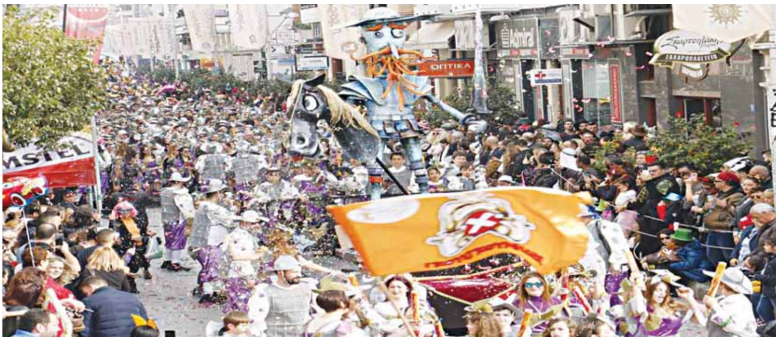
Το Καρναβάλι του Ρεθύμνου, με χορηγό επικοινωνίας την "ΚΡΗΤΗ TV", προσφέρει πάντα χαρά και αξέχαστες στιγμές.

Η μεγάλη παρέλαση του καρναβαλιού θα διεξαχθεί κατά παράδοση την Κυριακή της Τυρίνης, 2 Μαρτίου, όπου οι εκδηλώσεις θα κορυφωθούν, προσφέροντας ένα φαντασμαγορικό σόου πυρο-