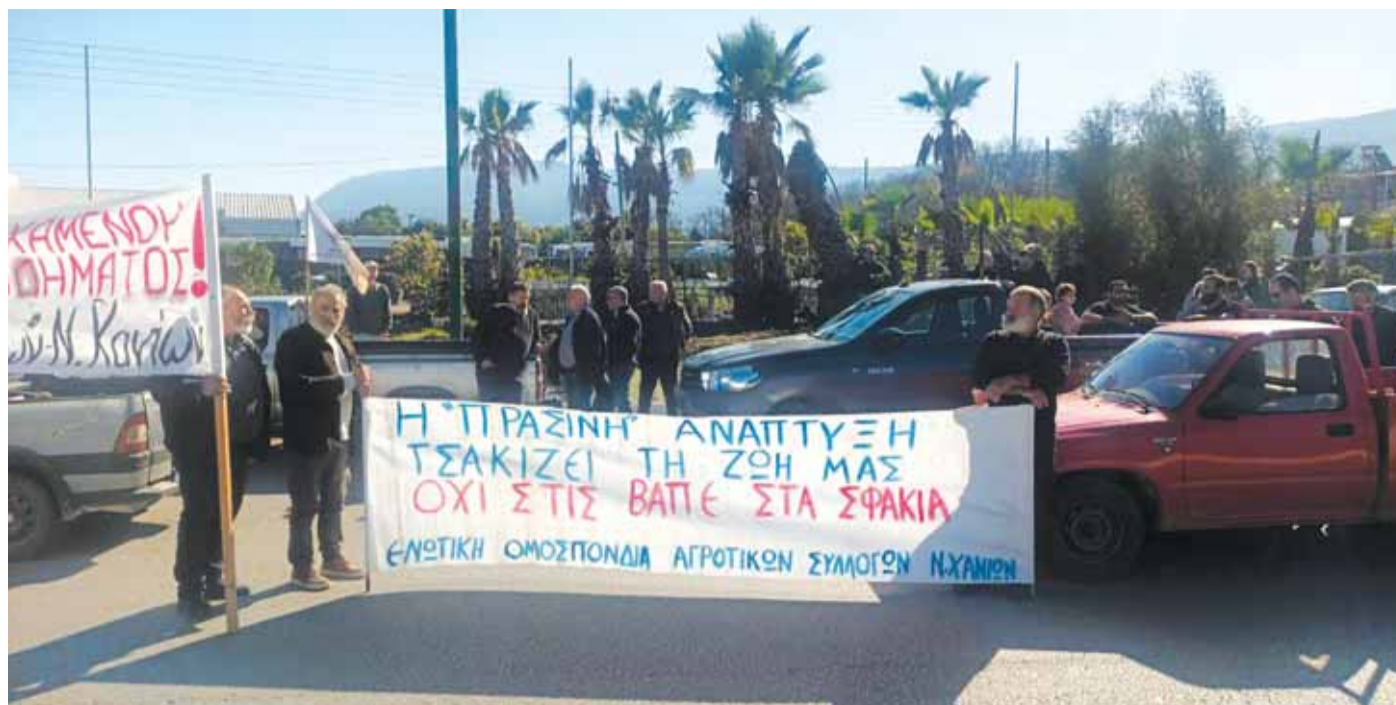
Υπάρχει μεγάλη ανησυχία για τη λειψυδρία και την απουσία μέτρων για την αντιμετώπιση του φαινομένου.

Οι μικρομεσαίοι αγρότες δεν αντέχουν άλλο την κοροϊδία της κυβέρνησης και του υπουργείου Αγροτικής Ανάπτυξης, που υποστηρίζει ότι έχει ικανοποιήσει τα αιτήματά τους