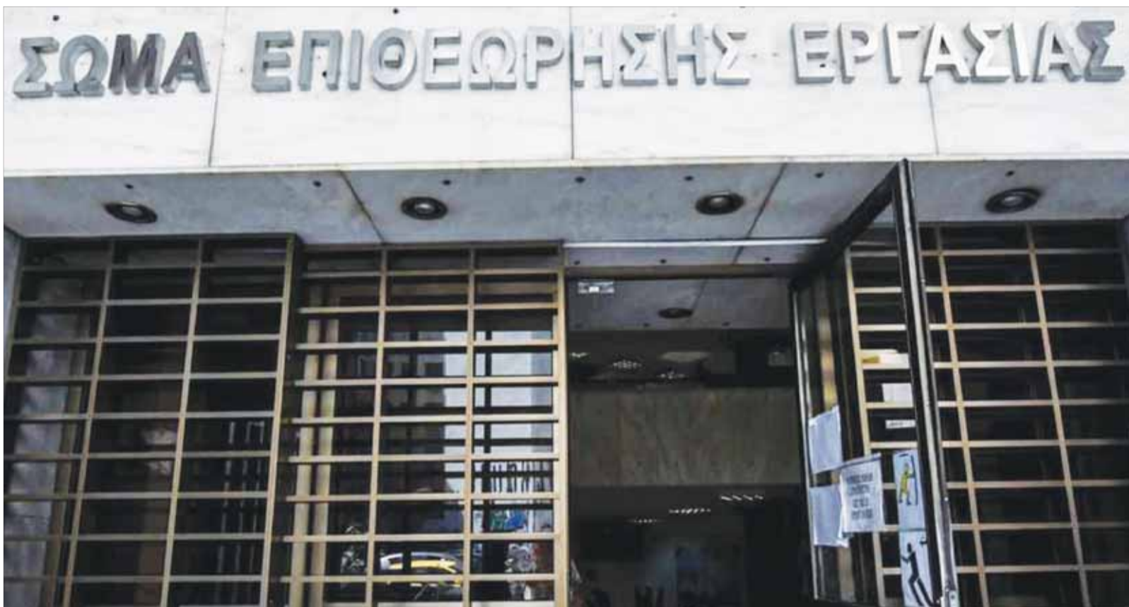
Αυξήθηκαν κατά 8% οι έλεγχοι σε επιχειρήσεις για παραβάσεις στην εργασιακή νομοθεσία.

Η μη καταγραφή των υπερωριών, η αδήλωτη απασχόληση και η μη πιστή εφαρμογή του μέτρου της ψηφιακής κάρτας εργασίας βρίσκονται στην κορυφή της λίστας των εργασιακών παραβάσεων. Πιο συγκεκριμένα, σύμφωνα με τα στοιχεία 12μήνου που δόθηκαν στη δημοσιότητα, από τις 12.875 παραβάσεις που εντοπίστηκαν πέρυσι, και οι οποίες σχετιζόνταν με τις εργασιακές σχέσεις, οι 7.565 (ποσοστό 58,75%) αφορούσαν υπερβάσεις ωραρίων. Από αυτές, οι 2.087 (ποσοστό 16,2%) ήταν παραβάσεις που καταγράφηκαν σε σχέση με την Ψηφιακή Κάρτα, για τις οποίες επιβλήθηκαν πρόστιμα 5.917.390 ευρώ. Η ΑΑΕΕ εντόπισε, σε 12μηνη βάση, άλλες 3.848 παραβάσεις στους πίνακες προσωπικού (πρόστιμα 9.051.980 ευρώ). Οι