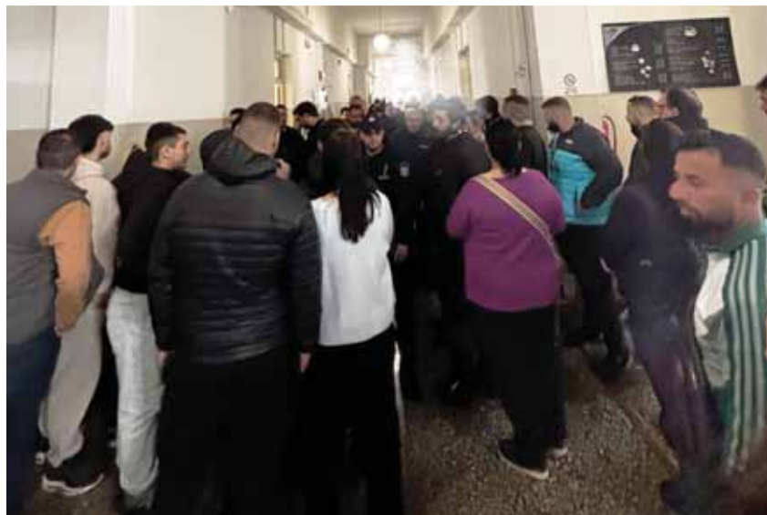
Πολίτες εισέβαλαν στο Δικαστικό Μέγαρο, με την ατμόσφαιρα να μυρίζει... μπαρούτι.