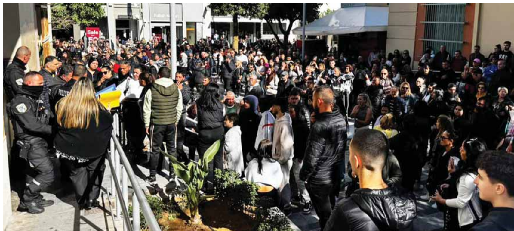
Πλήθος αγανακτισμένων πολιτών συγκεντρώθηκε έξω από το Δικαστικό Μέγαρο Ηρακλείου, εκφράζοντας την οργή του για το μαρτύριο του μικρού παιδιού.

■ Κύμα οργής σε ολόκληρη τη χώρα, με τη ζωή του μικρού Άγγελου να κρέμεται από μία κλωστή