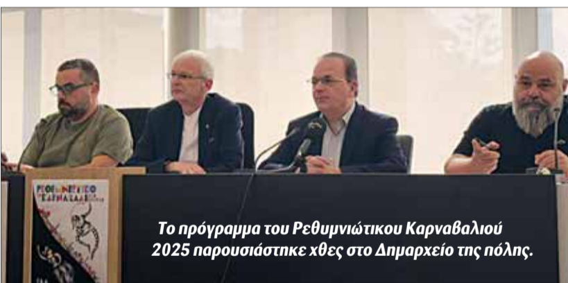
Το πρόγραμμα του Ρεθυμνιώτικου Καρναβαλιού 2025 παρουσιάστηκε χθες στο Δημαρχείο της πόλης.

■ Για άλλη μία χρονιά, το Ρέθυμνο ετοιμάζεται να μας γεμίσει με χρώμα, κέφι, ζωντάνια, φως και γιορτινή διάθεση