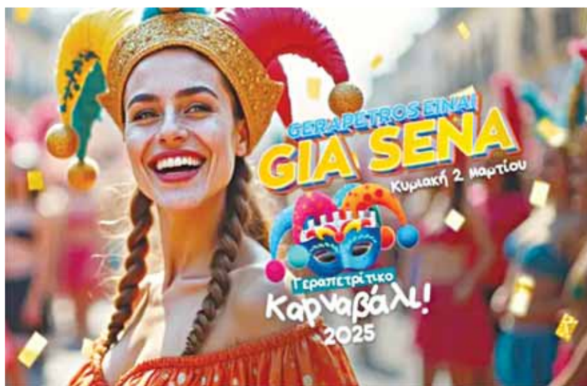
Οι προετοιμασίες για το φετινό Καρναβάλι βρίσκονται σε πλήρη εξέλιξη.