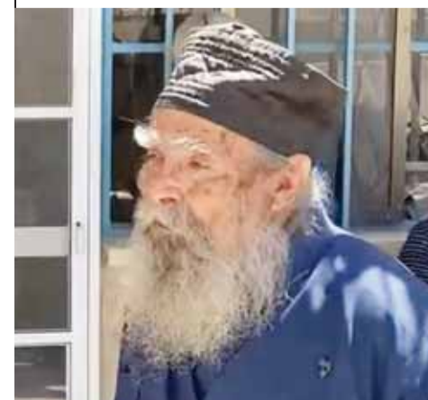
Ο Σεβασμιότατος Αρχιμανδρίτης Ιερόθεος, γνωστός και ως "Γέροντας Σηφάκης", έκλεισε τα μάτια του την Τρίτη το απόγευμα, μετά από 94 χρόνια λαμπρού βίου.

Ήταν ένας απλός άνθρωπος, με τόση αγάπη μέσα του, που πέρασε τα τελευταία χρόνια της ζωής του δίπλα στη Λαύρα του Οσίου Θεοδοσίου, όπου προσευχόταν για όλο τον κόσμο και λειτουργούσε καθημερινά.