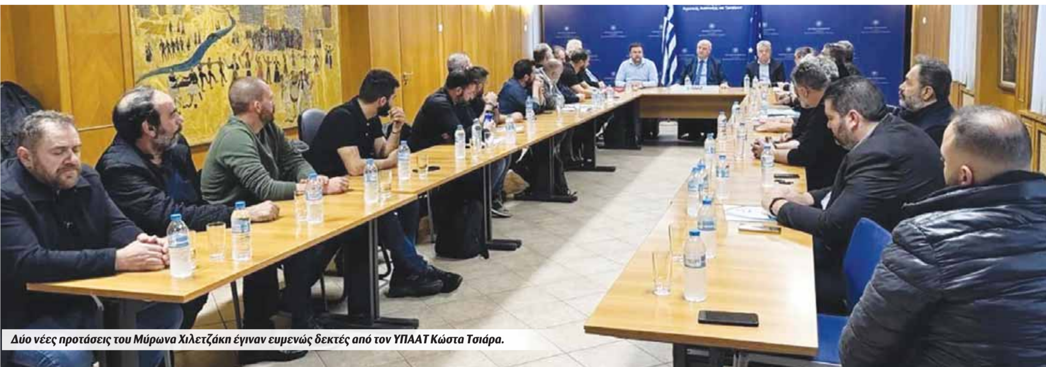
Δύο νέες προτάσεις του Μύρωνα Χιλετζάκη έγιναν ευμενώς δεκτές από τον ΥΠΑΑΤ Κώστα Τσιάρα.