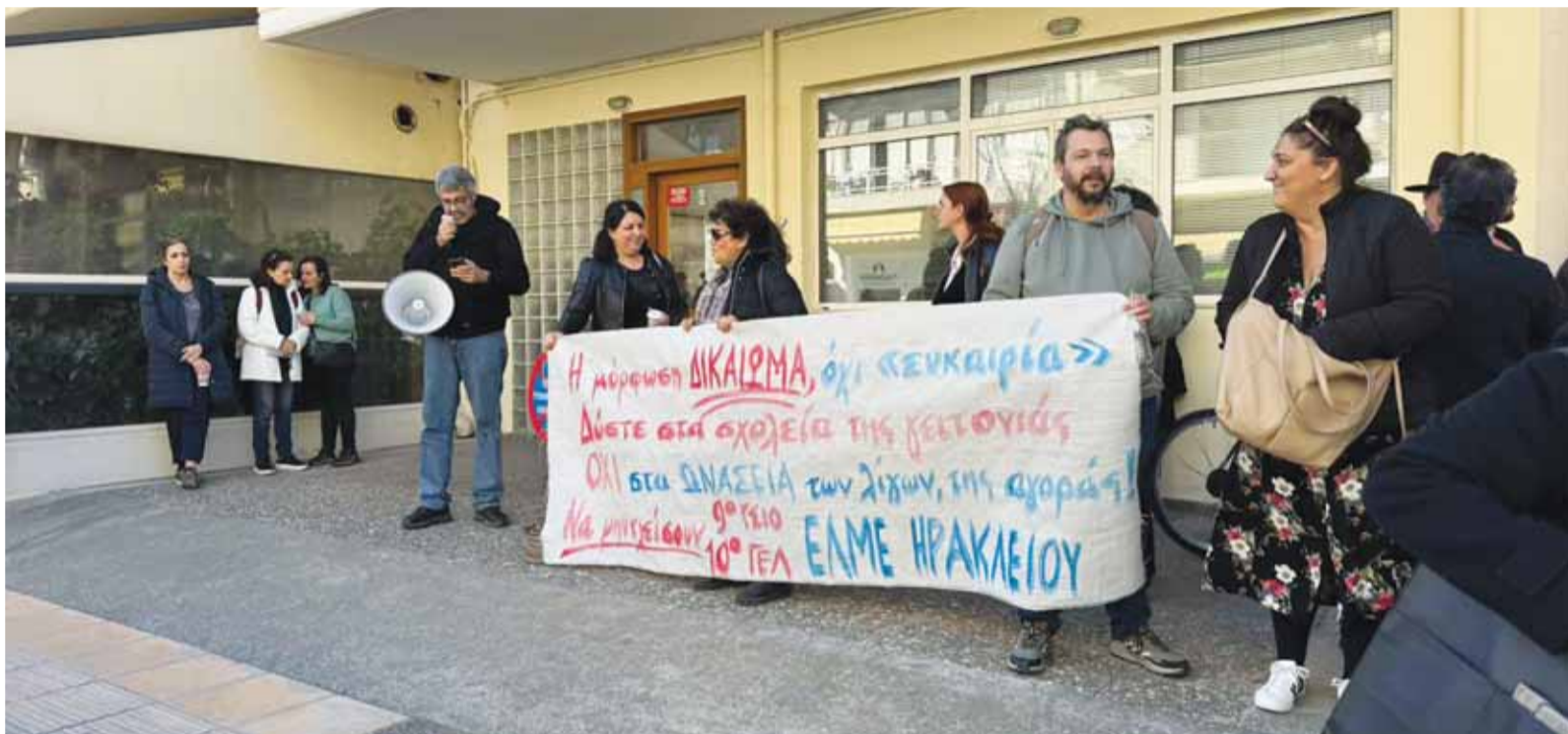
Για υποβάθμιση του δημόσιου χαρακτήρα της Παιδείας μιλούν οι εκπαιδευτικοί φορείς.

Παράλληλα, ως συντονιστής των κινητοποιήσεων, η ΕΛΜΕ ζητά «σύγχρονο και αναβαθμισμένο