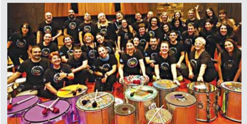
Οι πολυμελής ομάδα τυμπανιστών με το όνομα “Fasarioso”!