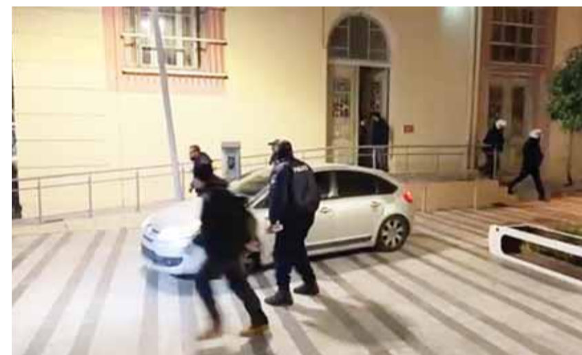
Υπό αστυνομική προστασία η μεταφορά τους.

επικήρσαν να σπάσουν τον αστυνομικό κλοιό, απαιτώντας να λιντσάρουν τους κατηγορούμενους. Οι αστυνομικές δυνάμεις δημιούργησαν ανθρώπινο τείχος στην κεντρική είσοδο του κτηρίου, εμποδίζοντας τους εξαγριωμένους πολίτες να εισβάλουν στον χώρο. Παρά την προσπάθεια αποκλιμάκωσης, σημειώθηκαν ρίψεις αντικειμένων, με αποτέλεσμα να σημειωθούν τραυματισμοί. Παράλληλα υπήρξε και μια σύλληψη 16χρονου, ο οποίος έσπασε