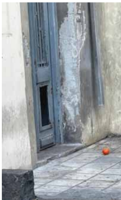
Η πόρτα που έσπασε ο 16χρονος.